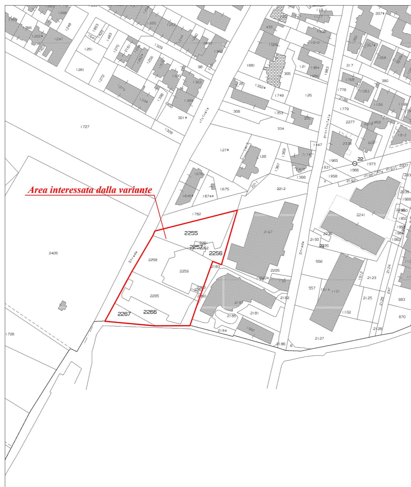
Estratto di mappa catastale