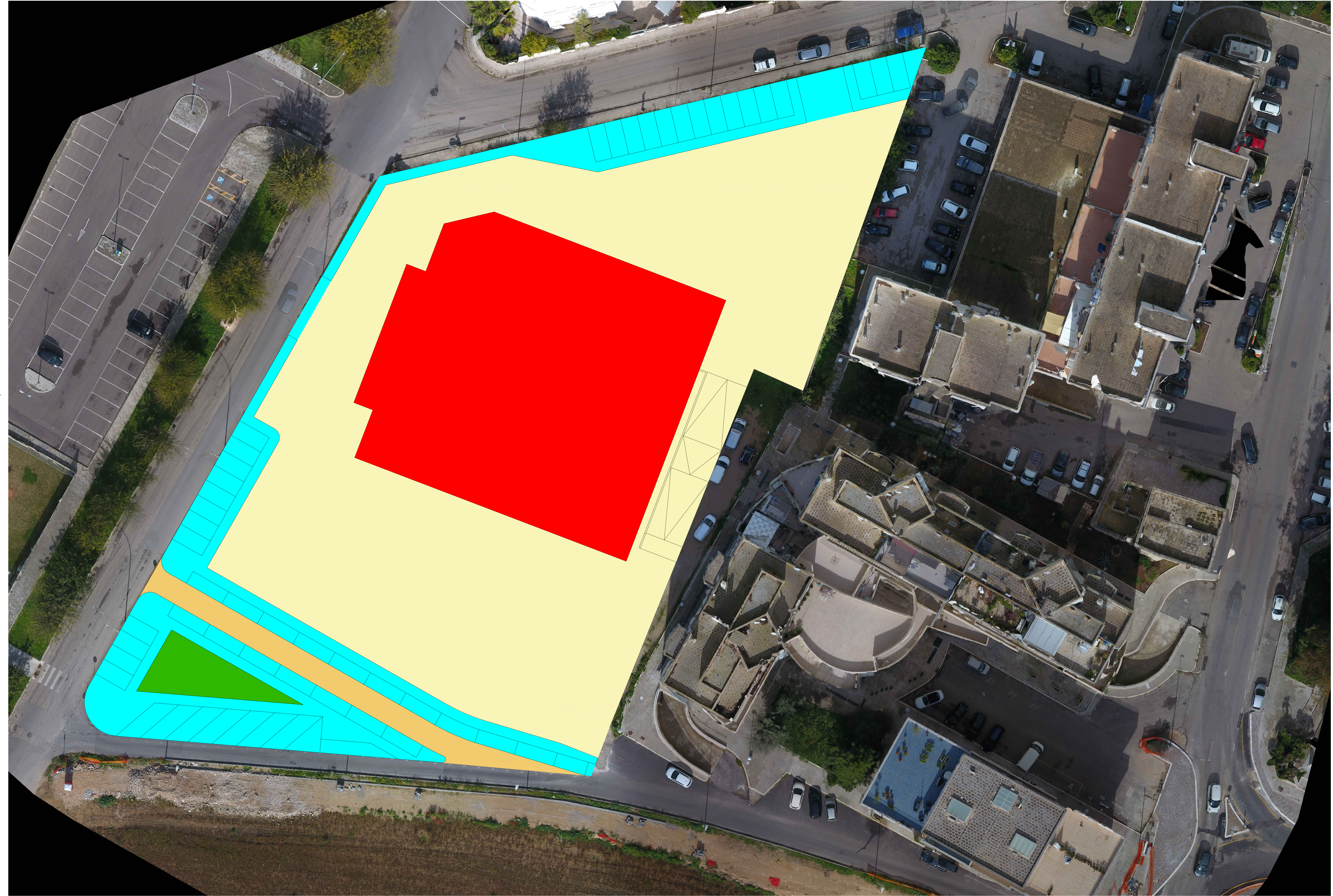
Planimetria generale Scala 1:200