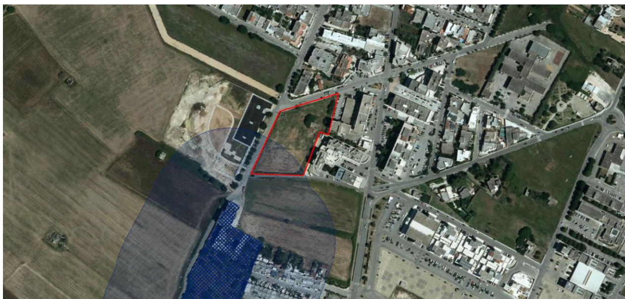
Componenti culturali e insediative – Ulteriori contesti paesaggistici – Aree di rispetto delle componenti culturali e insediative – Siti storico culturali con indicazione dell'area di intervento

Come già descritto al paragrafo precedente, una porzione dell'area interessata dal "Progetto di variante tipologica al Piano Particolareggiato delle aree interessate dalle nuove attrezzature di livello urbano – Area di intervento unitario A.I.U. A2 Tipologia edilizia T6" è interessata dal vincolo paesaggistico "Componenti culturali e insediative – Ulteriori contesti paesaggistici – Aree di rispetto dalle componenti culturali e insediative – Sito storico culturali" come indicato nell'immagine seguente estratta dal vigente PPTR.