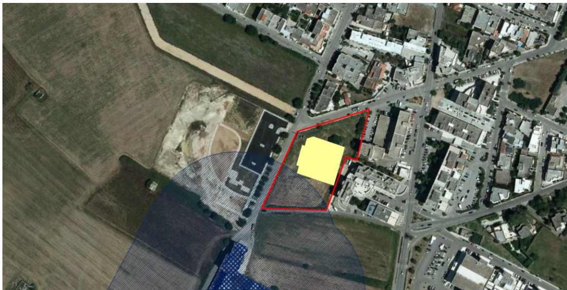
Stralcio PPTR con sovrapposizione sagome di progetto

Nell'immagine di seguito riportata è rappresentata l'area di intervento con il posizionamento del fabbricato rispettivamente al suddetto vincolo regolamentato dal Piano Paesaggistico Territoriale Regionale.